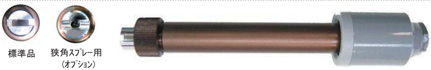
標準品 狭角スプレー用 (オプション)